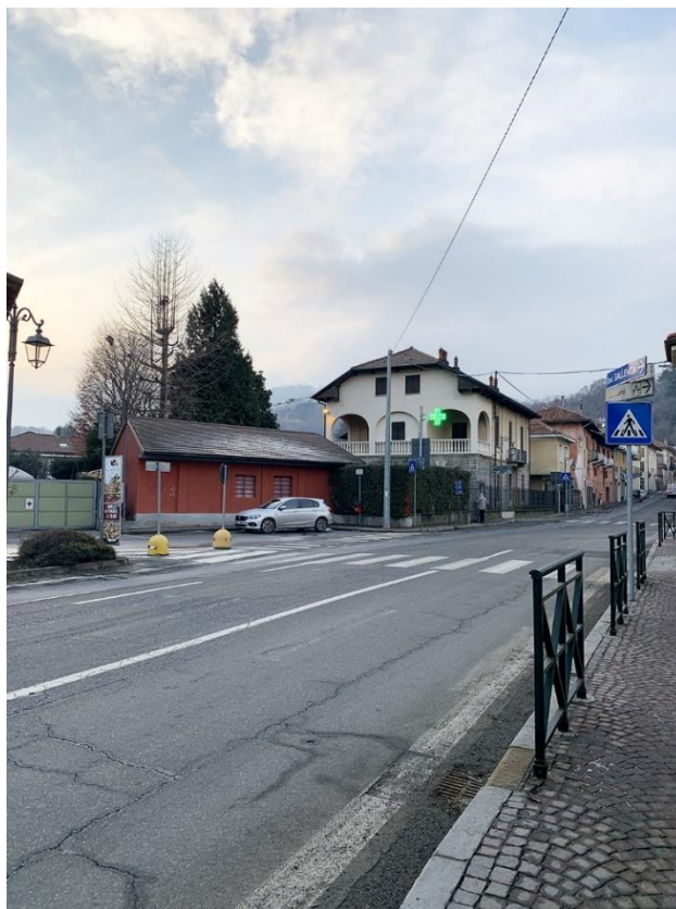
15 – via Mazzini, attraversamento esistente verso la zona commerciale