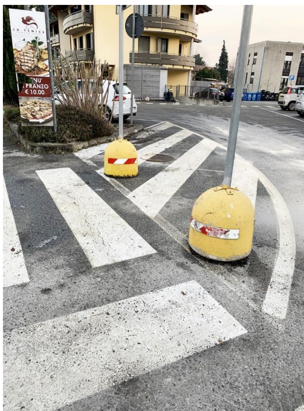
18 – via Mazzini, particolare segnaletica in corrispondenza attraversamenti pedonali esistenti