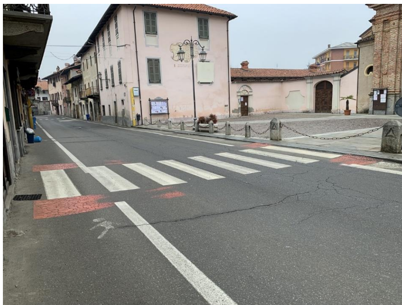
20 – attraversamento in corrispondenza sagrato Chiesa Parrocchiale