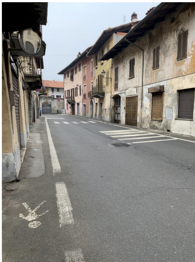
21 – rallentatori ottici e attraversamento verso il centro