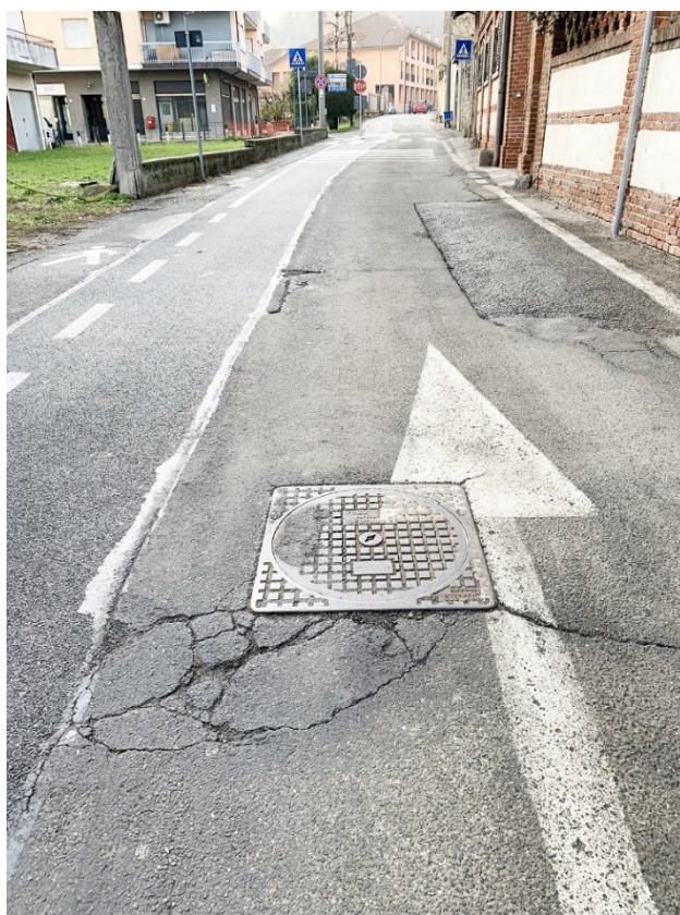
4 – particolare asfaltatura degradata