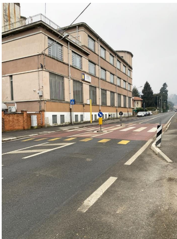
39 – piattaforma rialzata di attraversamento pedonale esistente