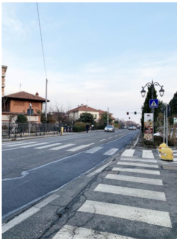
16 – via Mazzini, attraversamenti pedonali esistenti