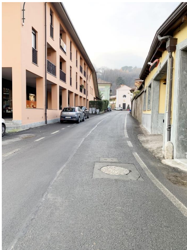
5 – vista verso incrocio con via Marconi