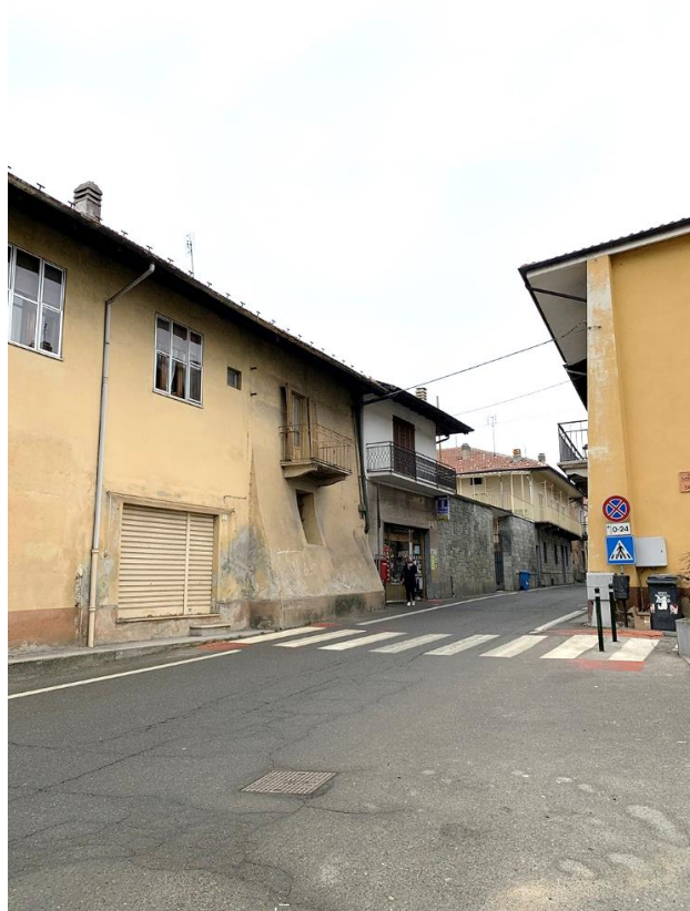
30 – particolare attraversamento pedonale esistente limitrofo a Piazza Donatori del Sangue