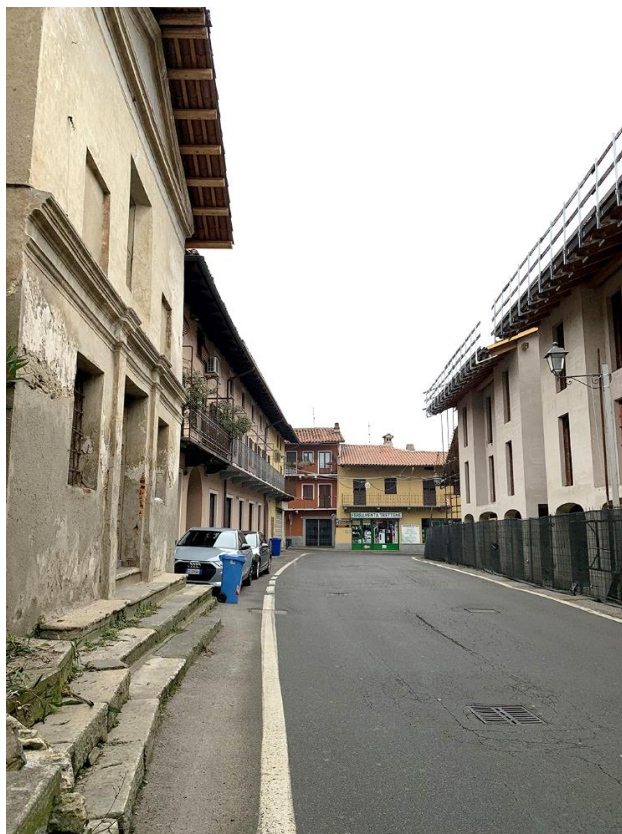
33 – vista in corrispondenza area di cantiere esistente