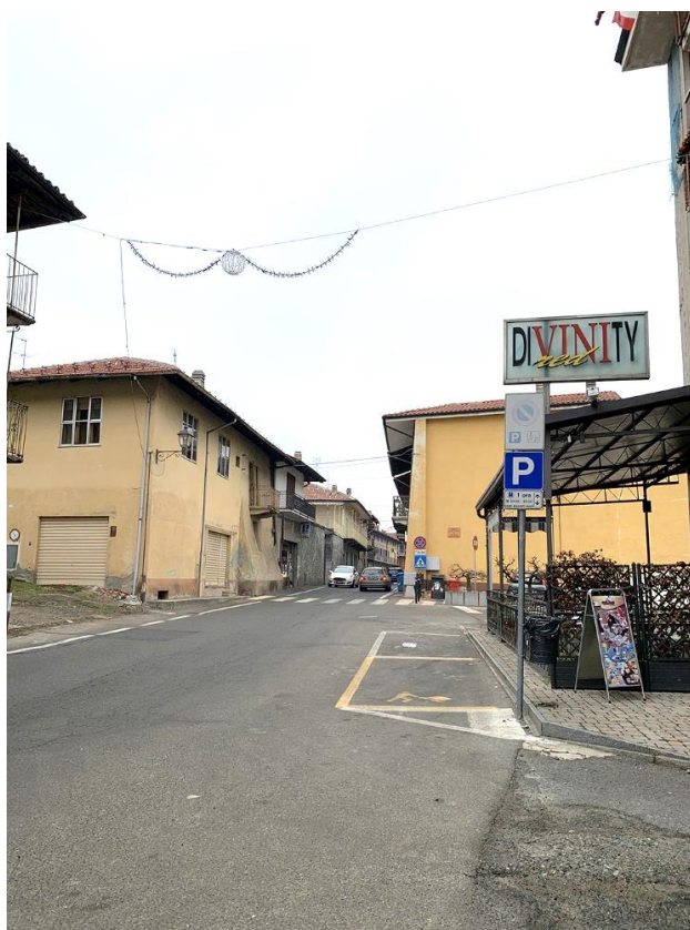
28 – zona di necessario miglioramento percorsi