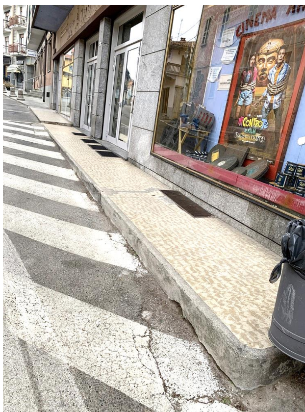
26 – zona di adeguamento percorsi e rifacimento pavimentazione