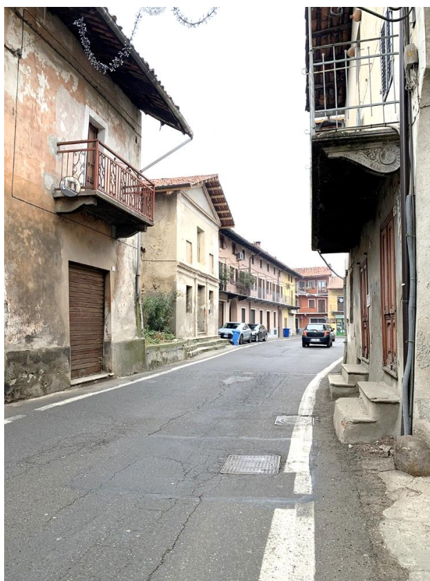
32 – proseguimento p013 direzione Cuornè