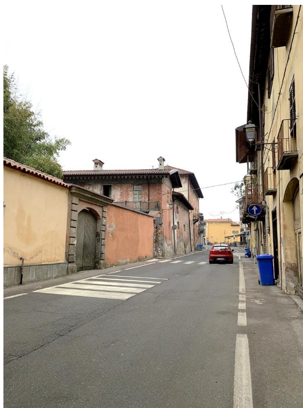
24 – rallentatori ottici e attraversamento in corrispondenza con via Piave