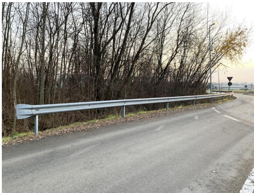
13 –barriera di protezione esistente da sostituire, lato area PIP