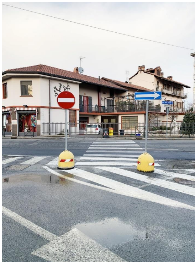
17 – via Mazzini, segnaletica in corrispondenza attraversamenti pedonali esistenti