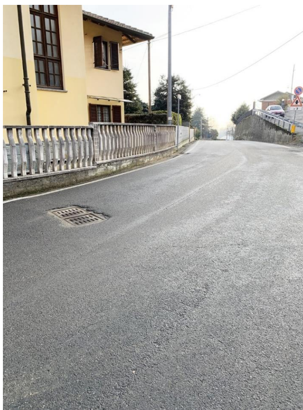
10 – vista via Marconi, messa in quota ultime griglie caditoie esistenti in prossimità incrocio via san Graudo