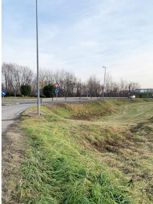
11 – barriera di protezione esistente da sostituire