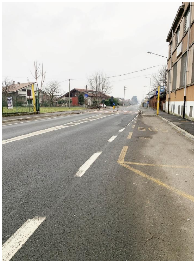
35 – p13c04 zona interessata davanti sede scuola professionale “Ciac”