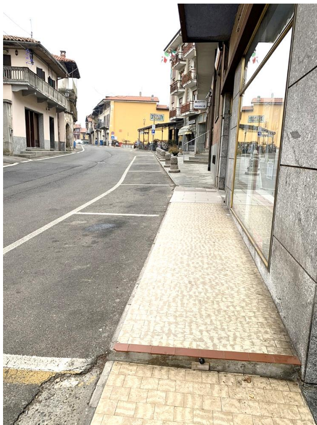
27 – particolare zona di adeguamento percorsi e rifacimento pavimentazione