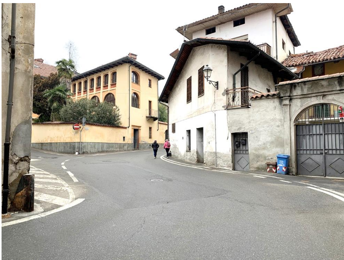
23 – curva e incrocio di via Pierino Grosso