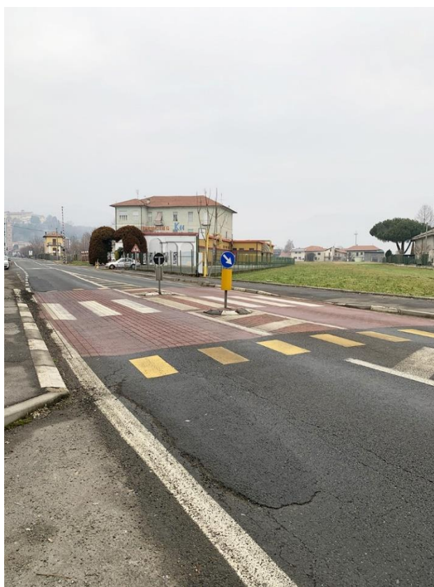
38 – piattaforma rialzata di attraversamento pedonale esistente e rappezzi asfaltatura