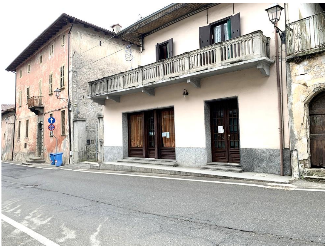
29 – particolare attività commerciale esistente