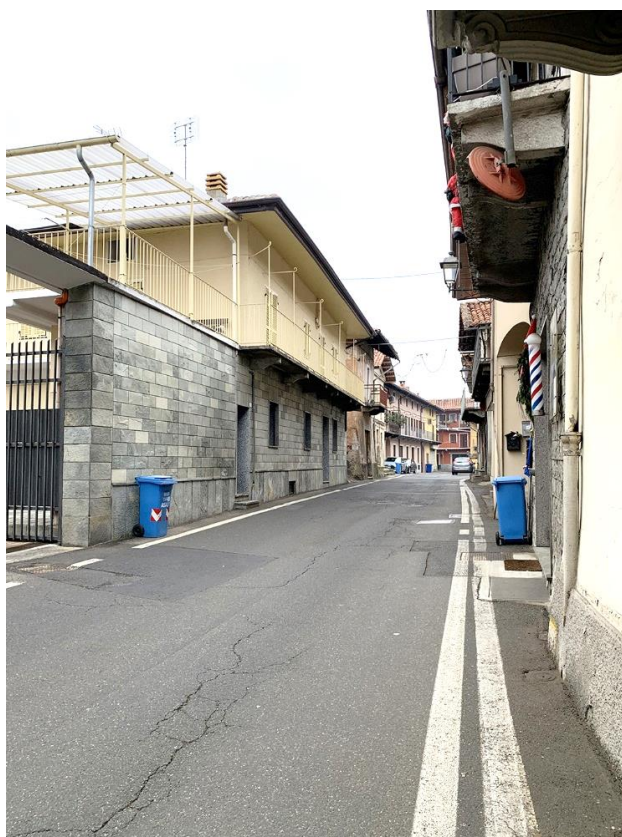
31 – vista p013 direzione Cuornè