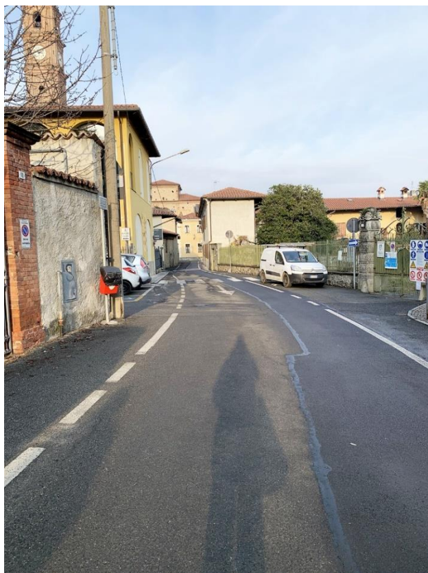
2 – vista verso Edifici Comunali in prossimità del Teatro