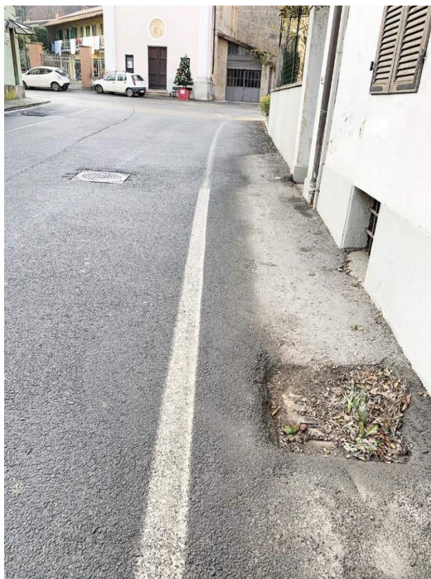
6 – particolare caditoia di raccolta acqua esistente completamente intasata