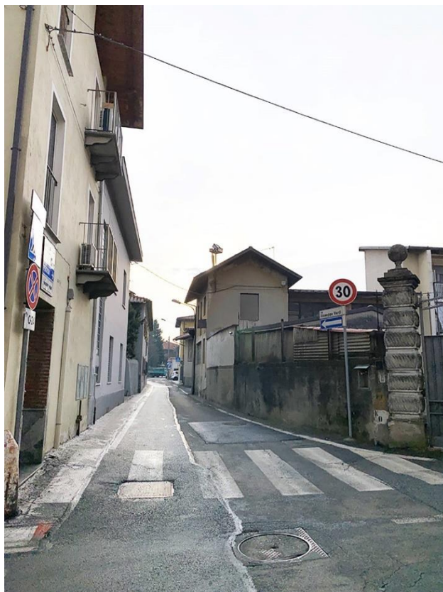
1 – p036 Km 0+000 (incrocio con p013)