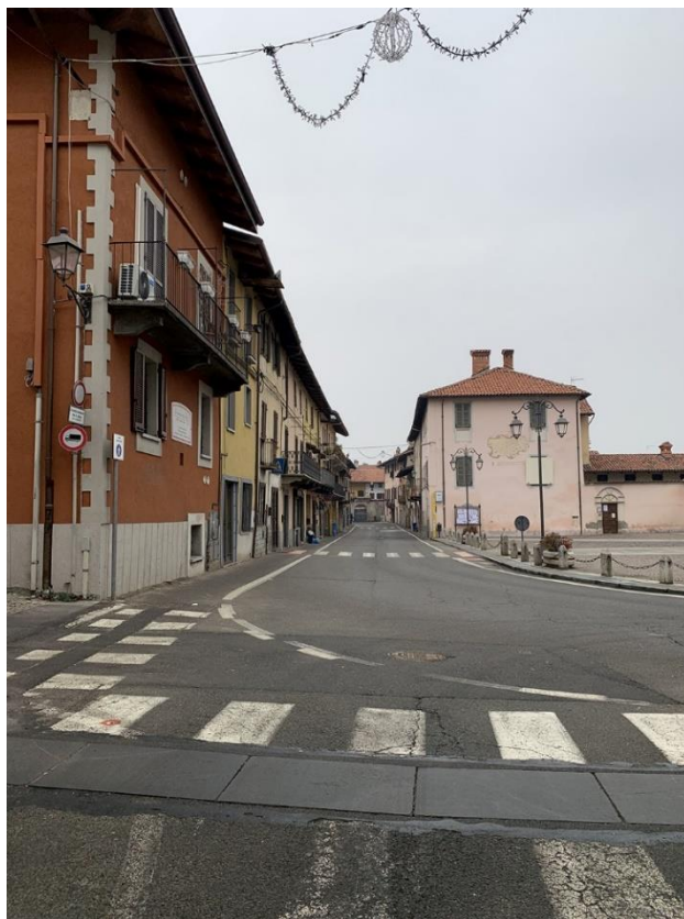
19 – via Martiri della Libertà, centro storico, incrocio con via Matteotti