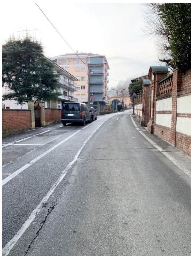
3 – vista asfalto degradato verso incrocio con corso Villanova