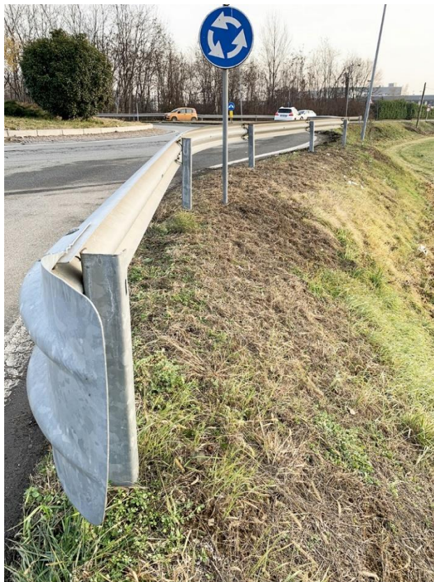
12– particolare barriera di protezione esistente da sostituire, lato campi agricoli