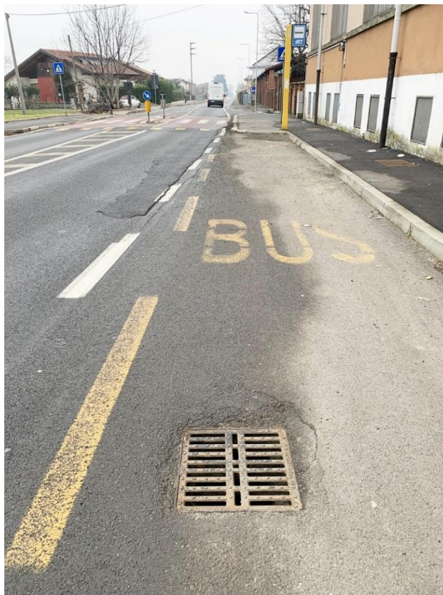
36 – particolare prima griglia esistente di raccolta acque stradali