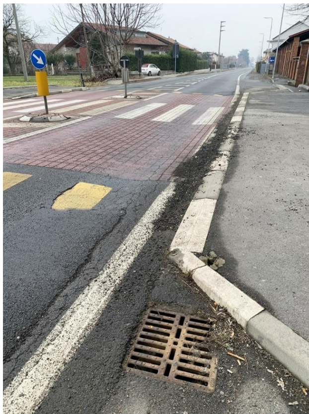
37 – particolare seconda griglia esistente di raccolta acque stradali