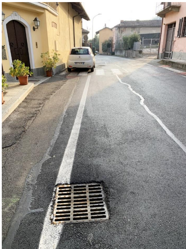
7 – vista via Marconi, griglia esistente da sostituire