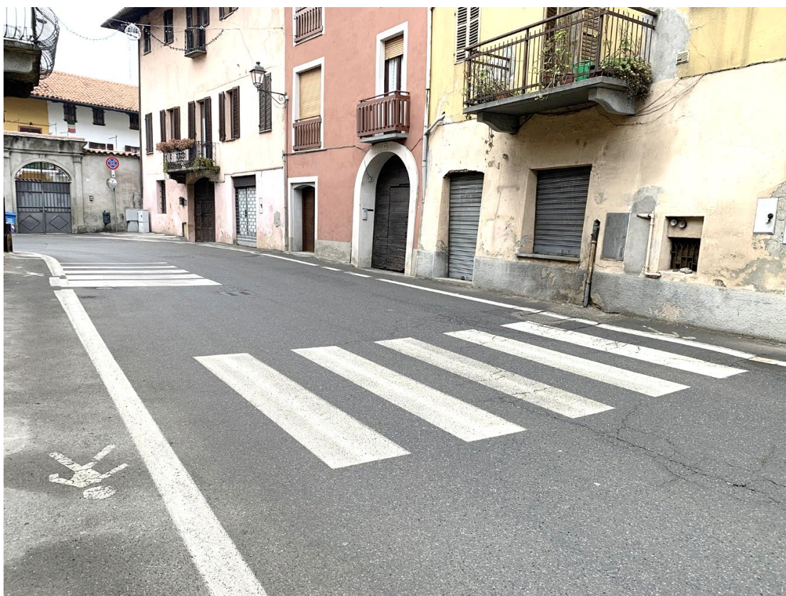
22 – particolare attraversamento prima della curva