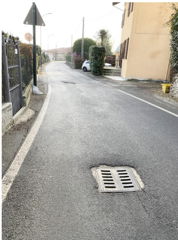
8 – vista via Marconi, messa in quota griglie caditoie esistenti