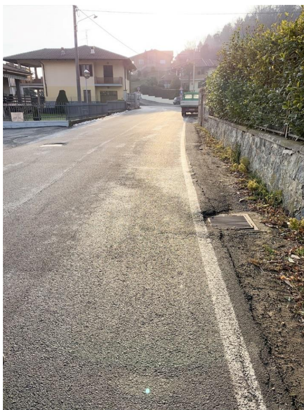
9 – vista via Marconi, messa in quota griglie caditoie esistenti verso incrocio via san Graudo