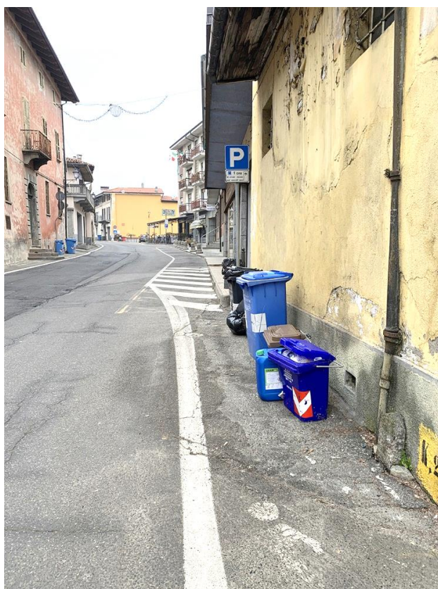
25 – zona parcheggi davanti edificio “cinema”