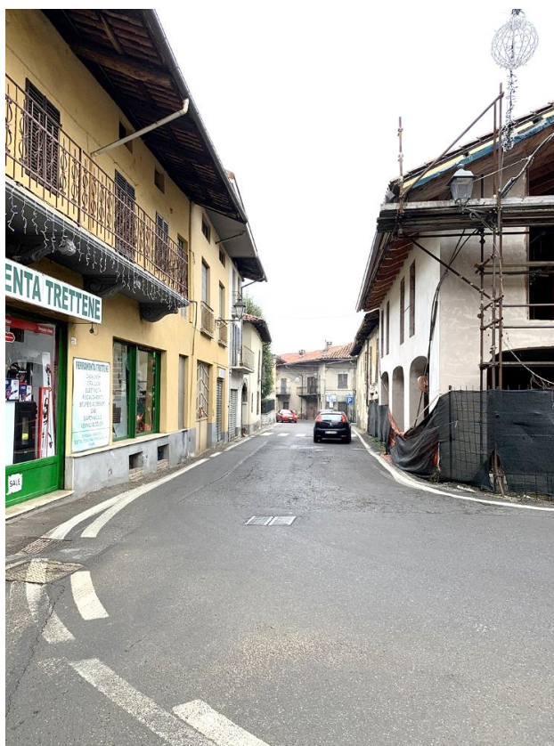
34 – vista attraversamento esistente, punto di ripresa da incrocio con via C. Battisti